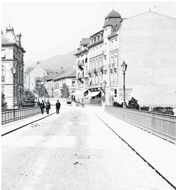
Arx wirkte am Bau der Repräsentativmeile mit. Rechts hinter dem «Aarehof» ist das mehrstöckige Haus seiner Familie.